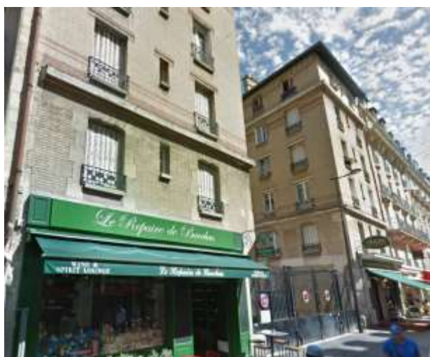
16-18 Rue Daguerre – 75014 PARIS