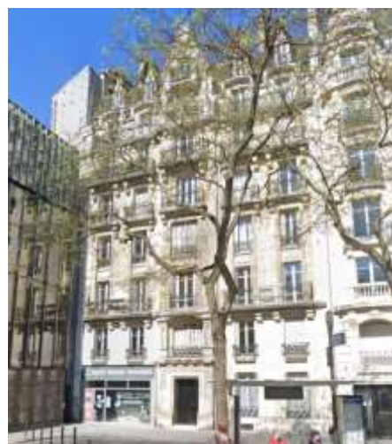
14 Place Denfert Rochereau – 75014 PARIS